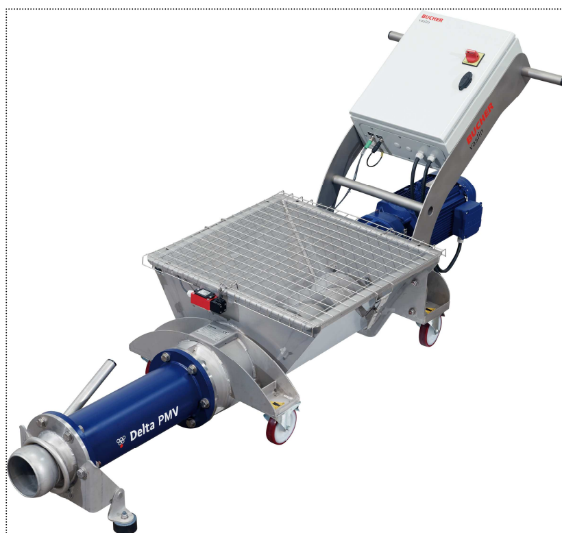
Delta PMV 2

В сердце винодельческого процесса. Насосы Delta PMV предназначены для приемки свежего винограда и адаптированы для перекачки сбродившей мезги (кроме Delta PMV 1).