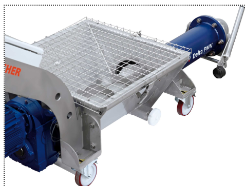
Заглушка сливного отверстия